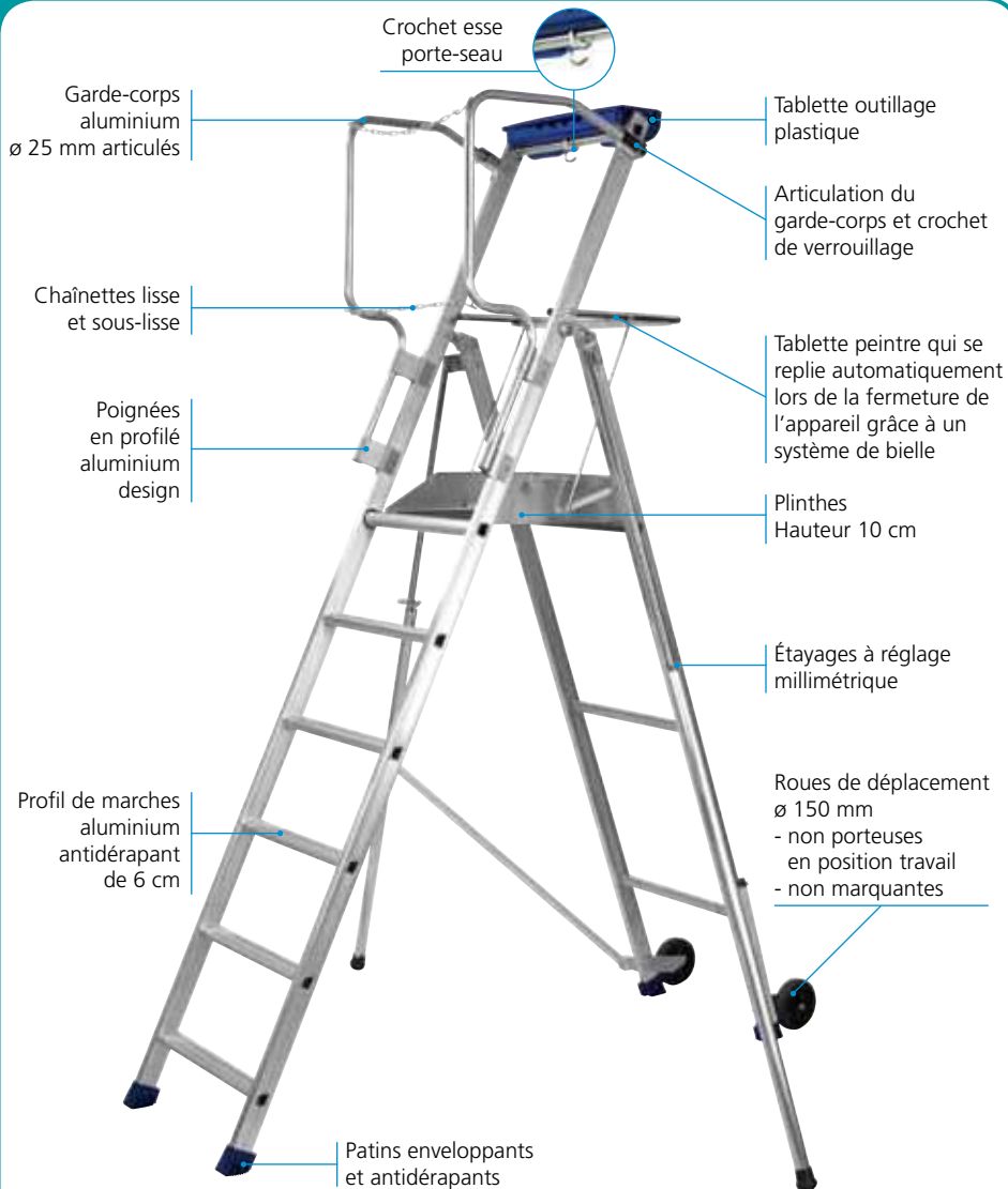
F6 hauteur de travail 3,45 m