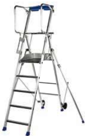
F5 hauteur de travail 3,20 m