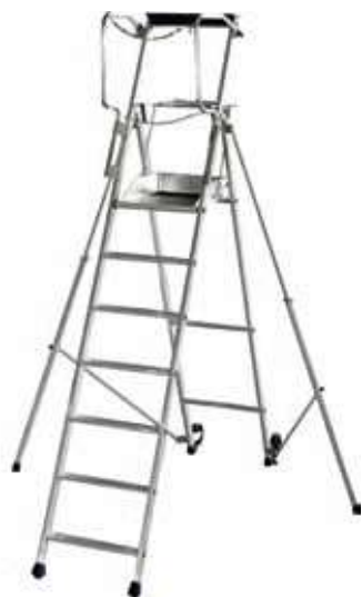
F7 hauteur de travail 3,70 m